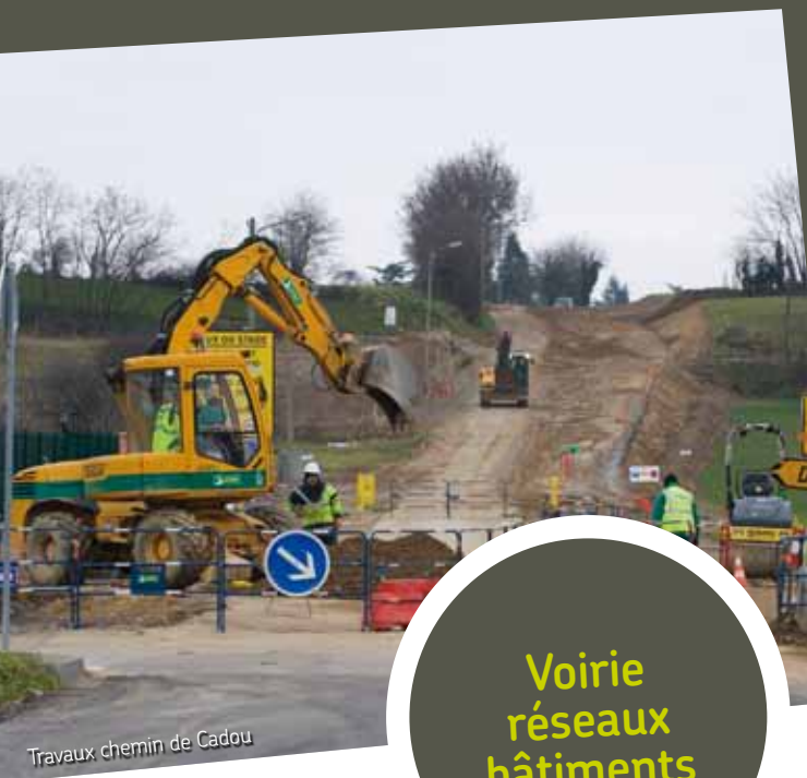
Travaux chemin de Cadou