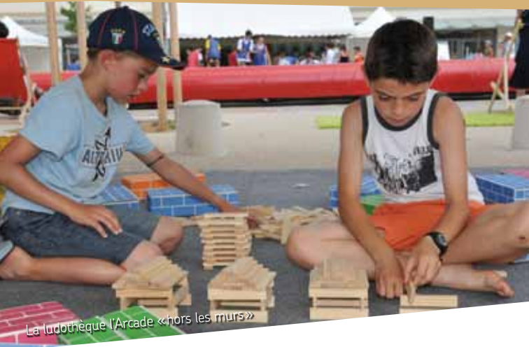
La ludothèque l'Arcade «hors les murs»