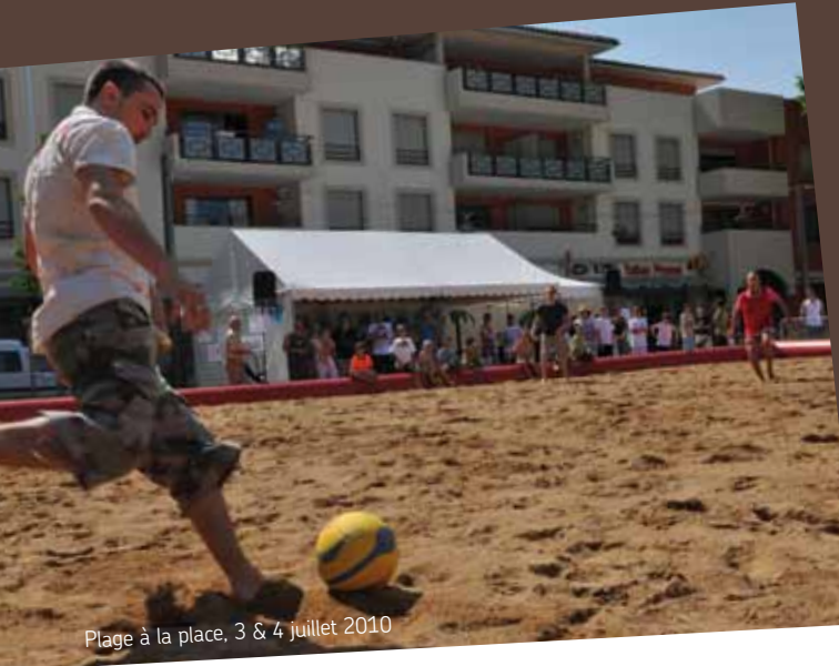
Plage à la place, 3 & 4 juillet 2010