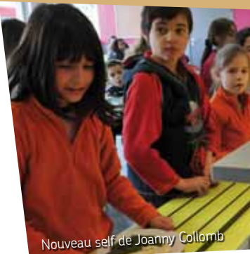
Nouveau self de Joanny Collomb