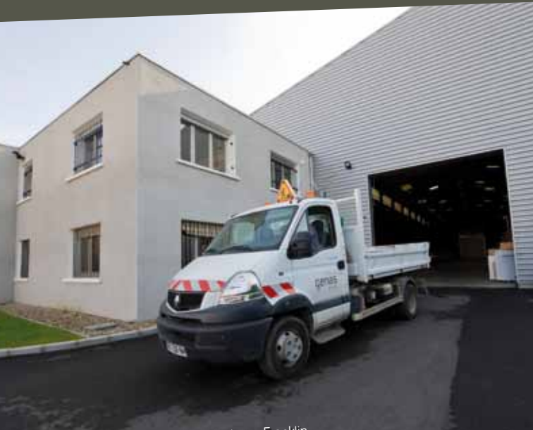
Nouveau Centre Technique Municipal, rue Franklin