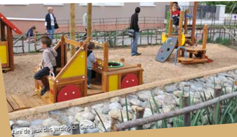
Aire de jeux des jardins de Gandil

Initié par les pompiers, le jumelage avec la ville allemande de Ronshausen fête son 35 e anniversaire en Allemagne. Une manifestation qui prend des tonalités particulières puisqu'elle coïncide avec les 950 ans de la ville allemande. Manifestations festives et culturelles au programme !