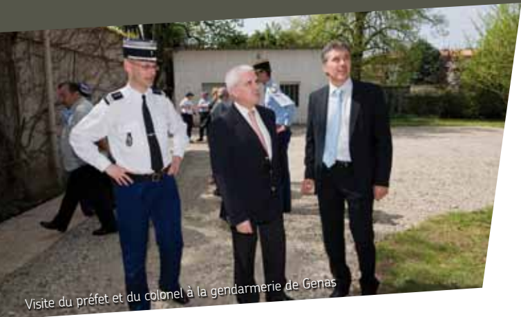
Visite du préfet et du colonel à la gendarmerie de Genas