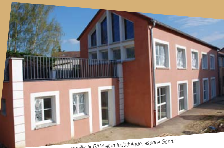
Ce nouveau bâtiment va accueillir le RAM et la ludothèque, espace Gandil