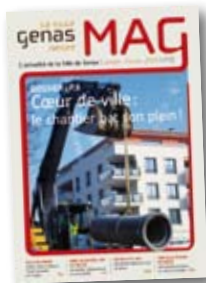
Un nouveau magazine

La nouvelle charte graphique de la ville, mise en place en octobre 2008, signifie que la communication est renforcée mais aussi que Genas la «ville nature» constitue un objectif à conquérir, un objectif dont les avancées vous sont communiquées très régulièrement à travers les lettres du maire ou le nouveau Genas Mag.