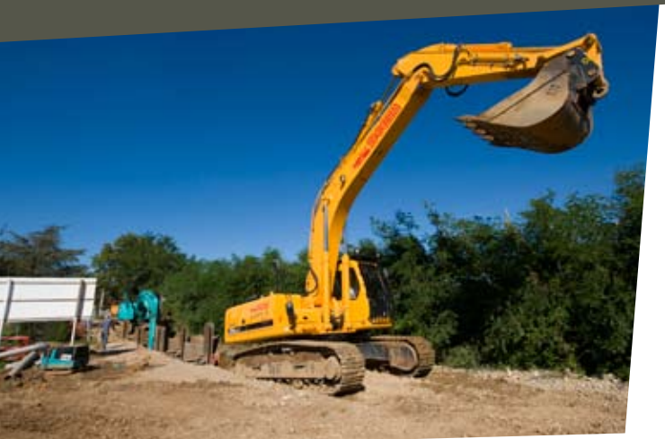
Travaux pour le passage des réseaux, secteur Reconfranches